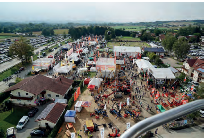
Blick vom Riesenrad zur Fachschau Energie-Umwelt-Bauen, dahinter Turnierplatz

Erfreulich war wieder, dass die Sicherheitsmaßnahmen durch vermehrte Polizeipräsenz allgemein von den Besuchern sehr positiv aufgenommen wurden.“ Werner Vierlinger