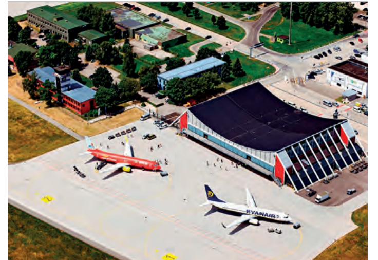
Das prozentual höchste Passagierwachstum verzeichnete der Flughafen Memmingen.

Die BEG bewertet die einzelnen Netze mit Hilfe von externen Testern und Fahrgastbefragungen. Die Ergebnisse des Qualitätsrankings haben unmittelbare finanzielle Auswirkungen auf die Betreiber der jeweiligen Netze. Erreicht ein Unternehmen den Wert null, sind die Erwartungen der BEG gerade erfüllt. Wer darüber liegt, erhält eine Bonuszahlung, wer Minuspunkte verzeichnet, zahlt Strafe (+100 Punkte = maximaler Bonus, -100 Punkte = maximaler Malus). □