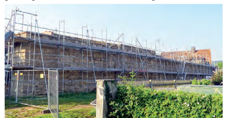
Sanierung der Stadtmauer: Unterschiedliche Höhen werden aus denkmalhistorischen Gesichtspunkten beibehalten.

Auch der „Kopf“ der Stadtmauer war beschädigt, da an dieser Stelle die Mauer abgerissen worden war. Das hier neu einzubringende Gestein wird umgearbeitet und den Stadtmauerstrukturen angepasst. Löcher und Lücken in der Mauer sowie in den Steinen selbst müssen ebenfalls ausgebeibert werden. Ursprünglich wurden bei der Stadtmauer feinkörnige Sandsteine (Dogger) verwendet. Dieses Material ist heutzutage bereits vollständig abgebaut – „Glück“ für die Wassertrüdingen Stadtmauer sowie für die Steinmetze, dass bei der Stadt al-