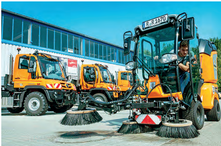
Christoph Bauer hat sich bei Beuthauser zusätzlich für die Kärcher-Fahrzeuge qualifiziert.