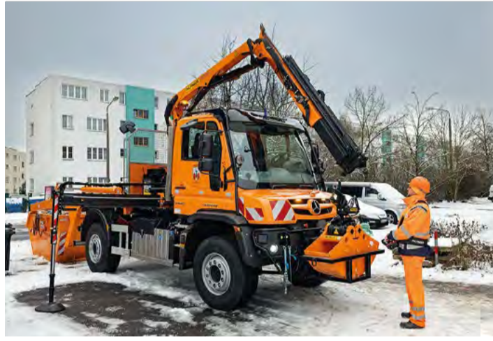
Der Unimog U 530 ergänzt das Portfolio als vielseitiger Geräteträger für den Ganzjahreseinsatz.

Im praktischen Einsatz zeigt sich die Stärke des Konzepts vor allem in der Kombination aus Straßen- und Geländetauglichkeit sowie der ganzjährigen Nutz-