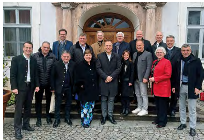
Treffen des Bezirksverbands Oberbayern des Bayerischen Landkreistags in der Abtei Frauenwörth.