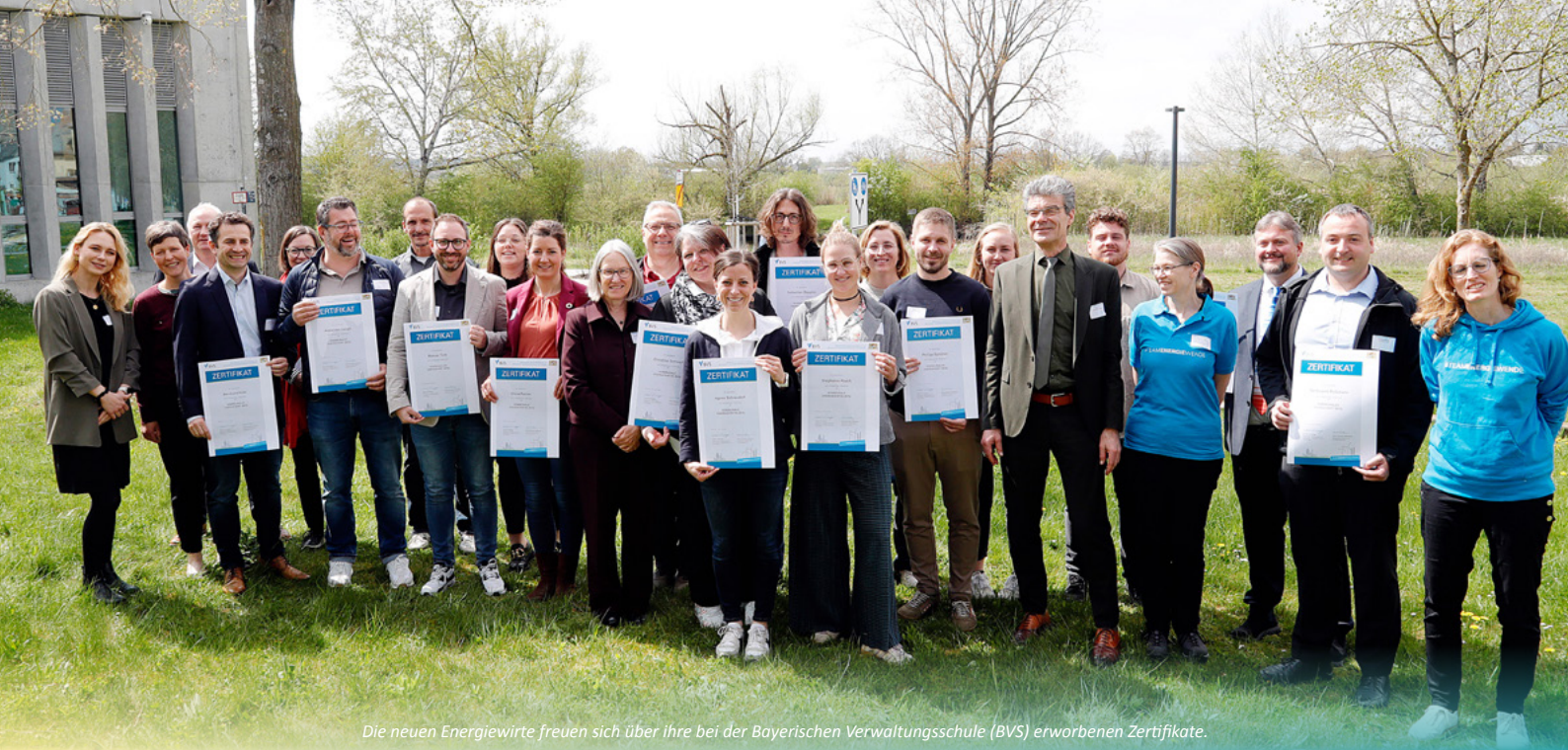
Die neuen Energiewirte freuen sich über Ihre bei der Bayerischen Verwaltungsschule (BVS) erworbenen Zertifikate.