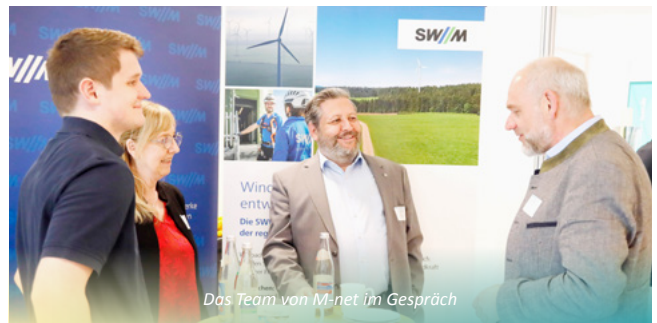
Das Team von M-net im Gespräch

Energie und Digitalisierung müssen zukünftig noch viel mehr gemeinsam gedacht werden. Wer Wärme, Strom, Tiefbau und Glasfaser koordiniert, spart Kosten, erhöht Anschlussquoten und stärkt die Zukunftsfähigkeit kommunaler Infrastruktur. CH