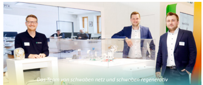
Das Team von schwaben netz und schwaben regenerativ

Trotz wirtschaftlicher Hürden verfolgt die energie schwaben Gruppe die Wasserstoffstrategie konsequent weiter. Der Aufbau eigener Elektrolyseanlagen sei notwendig, um praktische Erfahrungen entlang der gesamten Wasserstoff-Wertschöpfungskette zu sammeln und die Transformation der bestehenden Gasinfrastruktur aktiv mitzugestalten. Gleichzeitig eröffne das aktuelle regulatorische „Window of Opportunity“ bis Ende 2027 erhebliche Vorteile – etwa reduzierte Netzentgelte und erleichterte Anforderungen für die Nutzung erneuerbarer Energien. CH