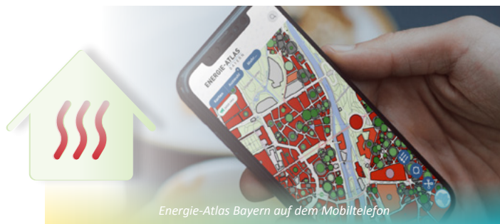
Energie-Atlas Bayern auf dem Mobiltelefon

Der Energie-Atlas Bayern ist zentrale Anlaufstelle für Fragen zum Energiesparen, zur Energieeffizienz und zu erneuerbaren Energien. Schnell, kompakt und fachlich fundiert gibt es hier unzählige Informationen und Daten. Das Angebot wird ständig weiterentwickelt – neu sind Karten zur Unterstützung der Wärmeplanung sowie Themenseiten zu Stromspeichern und zu Gewässerthermie.