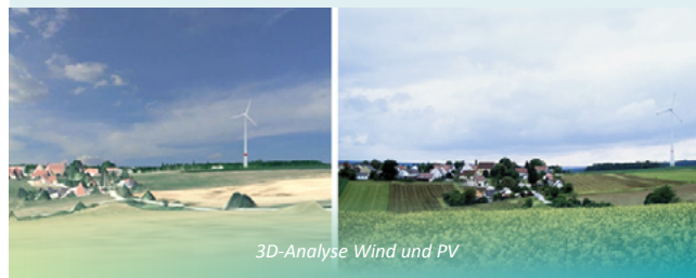
3D-Analyse Wind und PV