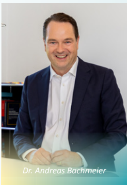
Dr. Andreas Bachmeier

Neue Wahlperiode mit frischem Wind: Wie man kommunale Energie-Vorhaben umsetzt, ohne an Beliebtheit einzubüßen Die Wahl ins Rathaus ist geschafft: Nun gilt es, Fortschritte anzupacken. Doch der vergleichende Blick schreckt oft ab. Viele Vorhaben scheitern an einer negativen öffentlichen Debatte oder werden im Klein-Klein zerredet. Dabei hätte Antizipation den Tumult vermeiden können. Die Devise lautet: Mut zum Akzeptanzdialog.