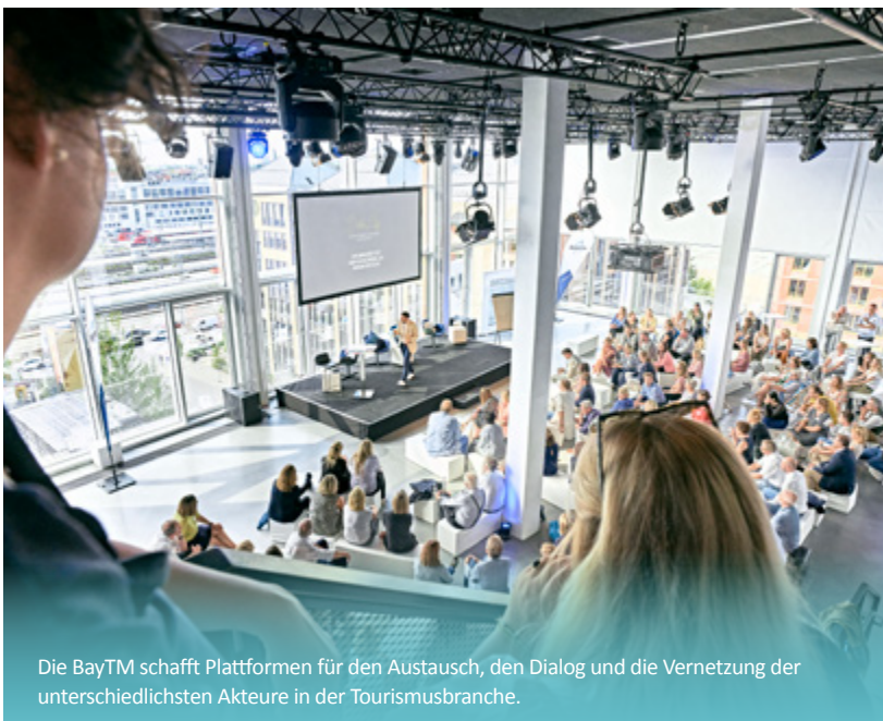
Die BayTM schafft Plattformen für den Austausch, den Dialog und die Vernetzung der unterschiedlichsten Akteure in der Tourismusbranche.

Damit der Tourismus in Bayern auch in Zukunft weiter so erfolgreich ist, unterstützt die BayTM die touristischen Akteure im Freistaat auch bei der Destinationsentwicklung. Sie setzt Impulse, koordiniert neue Themen und stellt ihnen strategische Werkzeuge insbesondere in den Bereichen Nachhaltigkeit und Digitalisierung zur Verfügung, um die Branche bei der Umsetzung ihrer neuen Aufgaben zu unterstützen. Darüber hinaus engagiert sich die BayTM intensiv für die Verbesserung des Images der bayerischen Tourismusbranche für mehr Tourismusakzeptanz. ■