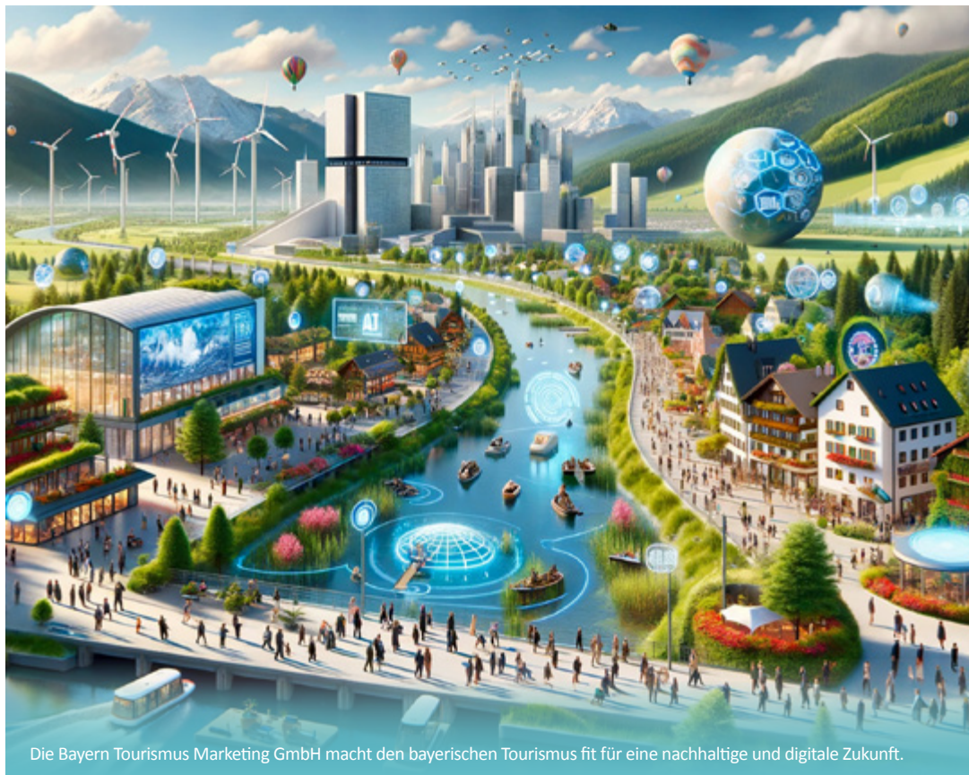
© Das Titelbild wurde mit der KI DALL-E erstellt.

Die Bayern Tourismus Marketing GmbH macht den bayerischen Tourismus fit für eine nachhaltige und digitale Zukunft.