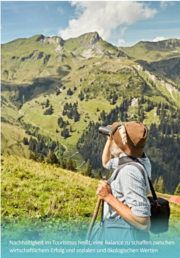
Nachhaltigkeit im Tourismus heißt, eine Balance zu schaffen zwischen wirtschaftlichem Erfolg und sozialen und ökologischen Werten