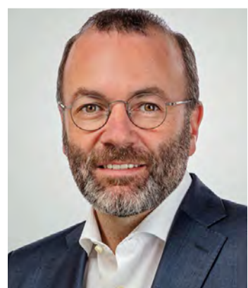
Manfred Weber.