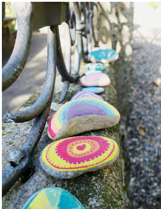
Erinnerungssteine am einem Grab.