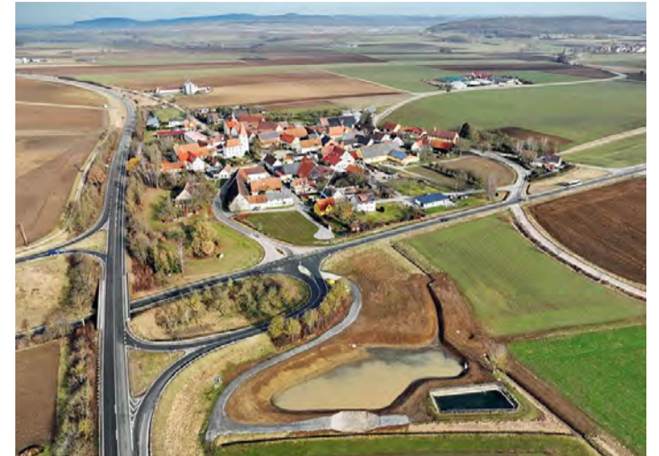
Blick auf den Ortsteil Neuherberg (Gemeinde Egersheim) mit ehemaliger Teichkläranlage, umgestaltet zum Wasserspeicher.

Naturnahe Gewässer und Auen können klimabedingte Stresssituationen besser überwinden. Hierbei spielt die Anpflanzung von standortgerechten Ufergehölzen eine zentrale Rolle. Sie bieten vielen Lebewesen im und am Wasser Lebensräume, beschat-