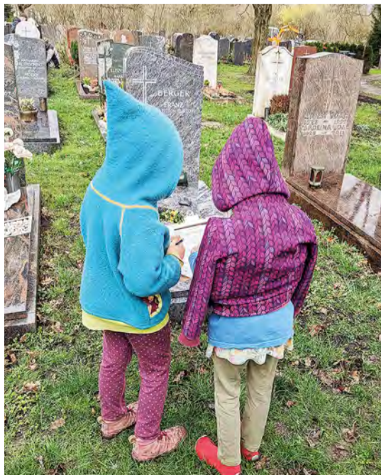
Friedhofsbesuch mit einer 3. Klasse.

Lippok: Neben der Tabuisierung des Todes liegt das auch an fehlenden Räumlichkeiten. Was Friedhöfe als Orte für Aufbahrungen so zu bieten haben, ist weit weg von schön und einladend. Es wäre eine wichtige Aufgabe der Städte und Gemeinden, der Verwaltungen der Friedhöfe, hier ansprechende Räume anzubieten.