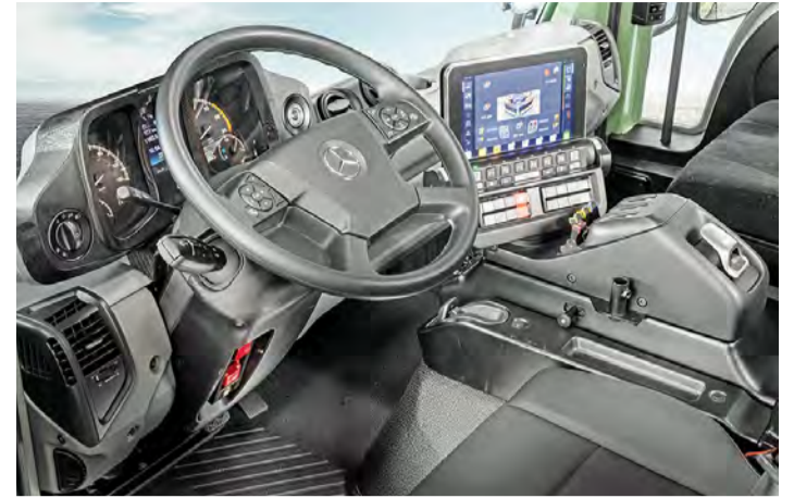
Neues Bediensystem UNI-TOUCH im Unimog Geräteträger.

Am Messestand finden Interessierte außerdem den vollelektrischen Mercedes-Benz eEonic 300 mit der Radformel 6x2 als Fahrgestell ausgestellt. Das Basisfahrzeug zeichnet sich durch ein im Wettbewerbsvergleich besonders niedriges Leergewicht aus. Ohne Aufbau können Besucher einen besseren Blick auf die Antriebsarchitektur des Fahrzeugs werfen. Der eEonic wird überwiegend im innerstädtischen