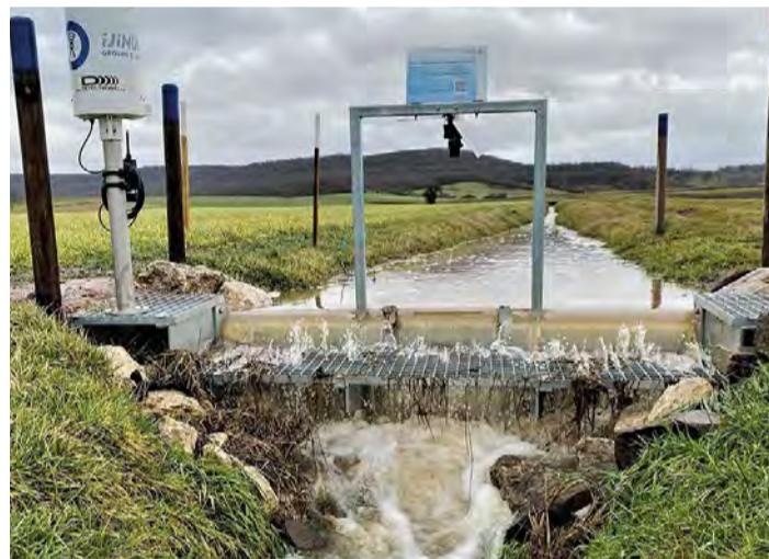
Gemeinschaftsprojekt „Wasserrückhalt in Grünen Gräben“ des Landkreises, Bayerischen Bauernverbands und Wasserwirtschaftsamtes Ansbach: Entwässerungsgräben werden in ihrer Funktion umgekehrt und dienen nun dem Wasserrückhalt.

Auch in der Wasser- und Abwasserwirtschaft ist die digitale Transformation in vollem Gange. Der Münchner Branchentreff gibt in selten verfügbarer Breite Antworten auf Fragen wie: Wo stehen wir in diesem Prozess? Welche Chancen und Risiken sind damit verbunden? Wohin kann in Zukunft die digitale Reise gehen? Räumlich verdichtet findet sich dieses Fokusthema in der Spotlight Area „Digitalisierung in der Wasserwirtschaft“ am Eingang West des Münchner Messegeländes. Auf dem von der DWA organisierten Sonder-