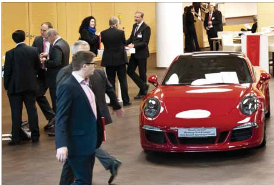
Motivation für Leistungsträger: Das Porsche Zentrum Nürnberg-Fürth-Erlangen präsentiert jedes Jahr seine schönsten Modelle bei der UnternehmerKonferenz. ☺

Nach der UnternehmerKonferenz fand am Abend die Verleihung des Bayerischen Gründerpreises 2015 statt – traditionell im Rahmen einer Festgala mit TV-Live-Aufzeichnung. Der Vizepräsident des Sparkassenverbands Bayern, Roland Schmautz, betonte den Erfolg des Gründerpreis-Wettbewerbs und sprach seine Anerkennung für die nominierten Konzepte und Unternehmensstrategien aus: „Die Qualität der Nominierungen ist im Laufe der 13 Wettbewerbsjahre beachtlich gestiegen. Die Konkurrenz der guten Vorschläge ist groß, die Erfolgsschwelle für die Preisträger liegt damit höher.“ ☺