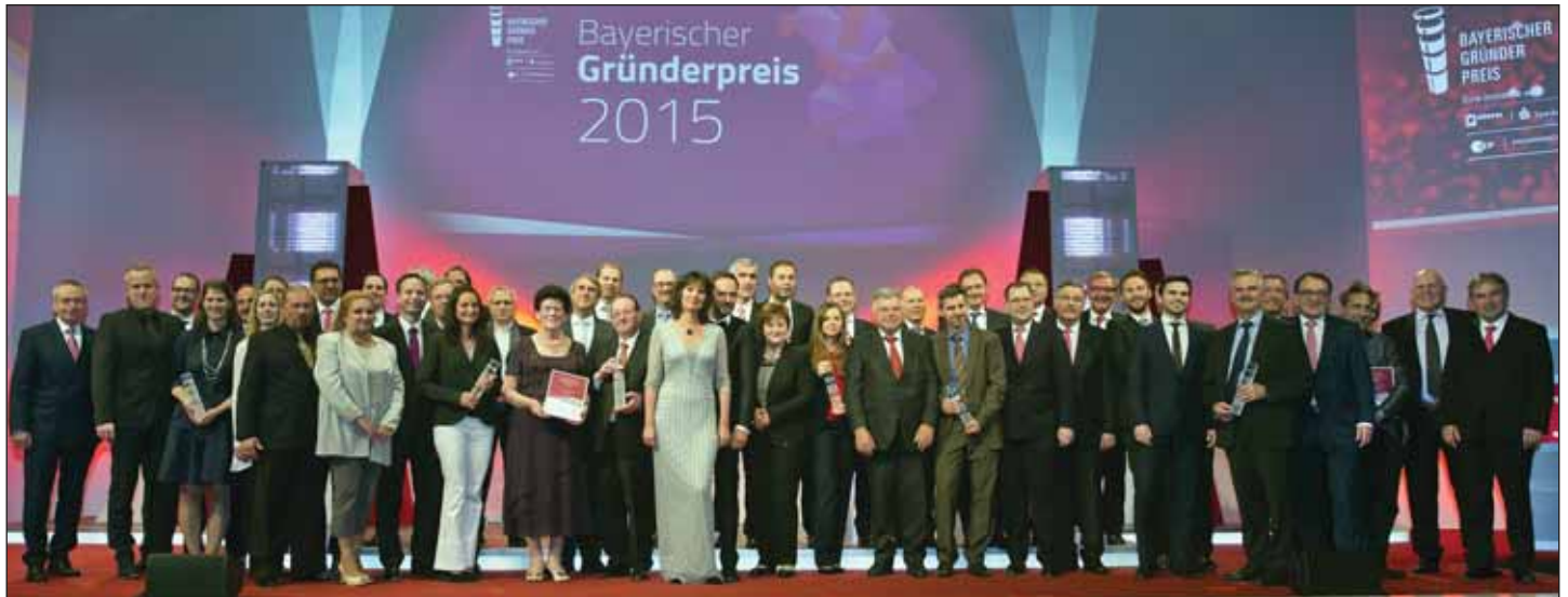
Glanzvoller Abschluss der diesjährigen Sparkassen-Unternehmerkonferenz: Die Verleihung der Bayerischen Gründerpreise im NCC.