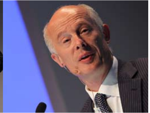
Zu raschem Umdenken rief der Klimaforscher Prof. Dr. Hans Joachim Schellnhuber auf.