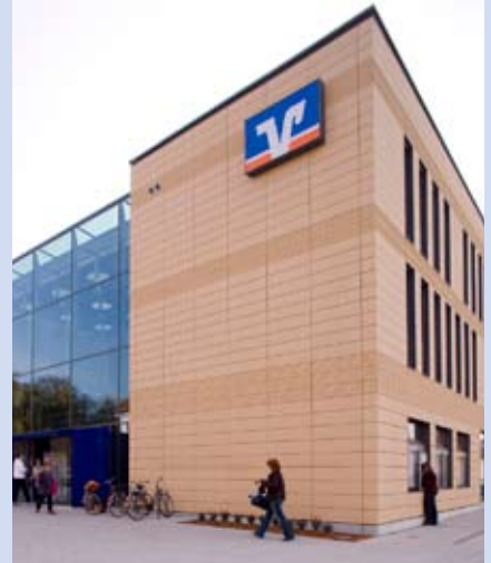
Der Haftungsverbund der Volksbanken und Raiffeisenbanken bewährt sich seit beinahe 80 Jahren.

Die Drei-Säulen-Struktur des deutschen Bankensystems ist wesentlicher Grund für seine Stabilität in der Finanz- und Wirtschaftskrise. Dabei waren die tragenden Säulen die dezentralen Verbände der Regionalbanken. Sie waren resistent gegen Ansteckungseffekte, Marktversagen und Vertrauensverlust. Denn die freiwilligen Haftungsverbände gewährleisten den Zusammenhalt und die Stabilität der regional tätigen Banken. Durch eine Pflichtteilnahme von Genossenschaftsbanken und Sparkassen an der gesetzlichen Einlagensicherung würden die eigenständigen Regionalbanken-Haftungsverbände geschwächt.