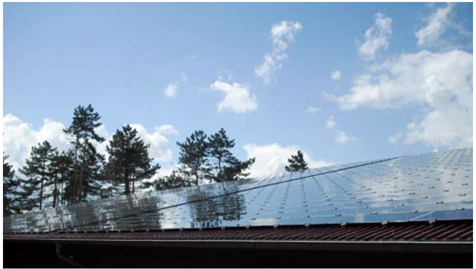
Genossenschaftliche Energiegewinnung: Solaranlage der Friedrich-Wilhelm Raiffeisen Energie eG im Landkreis Rhön-Grabfeld auf dem Dach einer Reithalle.

Die Nahwärme Hüssingen eG ist Eigentümerin des Leitungsnetzes und der Übergabestationen in den Häusern. Den Anschluss der jeweiligen Heizungen müssen die Hausbesitzer selbst übernehmen. Insgesamt 50 Haushalte heizen bereits mit der Abwärme. Mehr als 70 Häuser hängen schon am Leitungsnetz der Genossenschaft, 13 weitere Anschlüsse sind vorgesehen. Etwa 95 Prozent des Dorfs sind dabei.