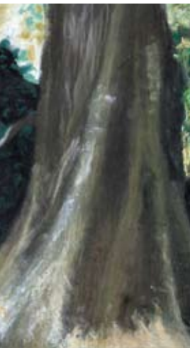
Gewinnerbild (7. bis 9. Klasse) von Vincent T.: „Abholzen ist ein Klimakiller.“ (oben)

13,3 Mio. Euro spendeten allein die bayerischen Volksbanken und Raiffeisenbanken 2009.