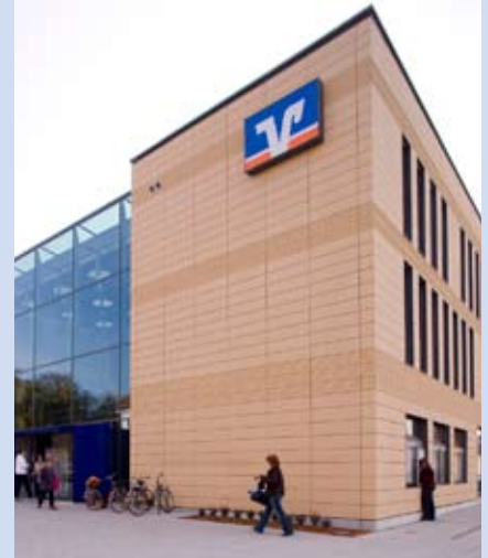
Der Haftungsverbund der Volksbanken und Raiffeisenbanken bewährt sich seit beinahe 80 Jahren.

Die Drei-Säulen-Struktur des deutschen Bankensystems ist wesentlicher Grund für seine Stabilität in der Finanz- und Wirtschaftskrise. Dabei waren die tragenden Säulen die dezentralen Verbände der Regionalbanken. Sie waren resistent gegen Ansteckungseffekte, Marktversagen und Vertrauensverlust. Denn die freiwilligen Haftungsverbände gewährleisten den Zusammenhalt und die Stabilität der regional tätigen Banken. Durch eine Pflichtteilnahme von Genossenschaftsbanken und Sparkassen an der gesetzlichen Einlagensicherung würden die eigenständigen Regionalbanken-Haftungsverbände geschwächt.