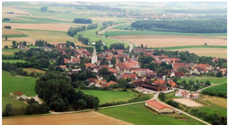
Ostheim aus der Luft. Fast die ganze Ortschaft engagiert sich in der Genossenschaft.

stellen hier nicht nur die Wärmeversorgung der Haushalte sicher, sondern schützen auch die Umwelt und stärken die Dorfgemeinschaft.