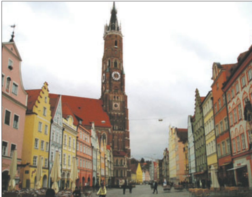
Ein Tagungsort mit allem Komfort: Die Niederbayern-Metropole Landshut. □

„All die betriebswirtschaftlichen Kennzahlen sprechen eine klare Sprache“, bilanzierte der Sparkassenpräsident: „Unser Geschäftsmodell hat sich erneut bewährt. Wir wollen diese Verlässlichkeit in jeder Hinsicht erhalten.“ Das sei es, was hinter dem Motto des diesjährigen Sparkassentages stecke: „Nachhaltig erfolgreich. Sparkassen. Gut für Bayern.“