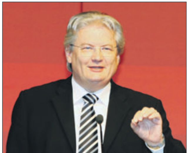
Prof. Sigmund Gottlieb. □

„Sind wir nicht zu einer Wegschaugesellschaft degeneriert - uninteressiert, nachlässig, feige, tatenlos, verantwortungslos?“, fragte Gottlieb und ergänzte: „Und sind