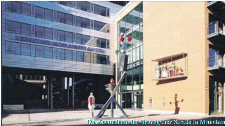
Die Zentrale in der Warnigauer Straße in München