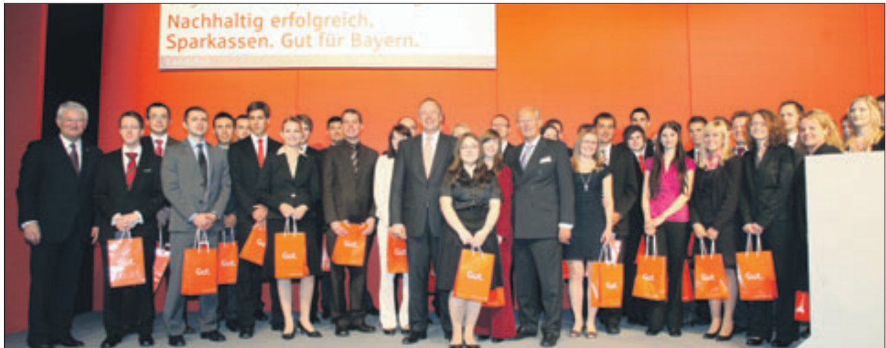
Fast 50 junge Mitarbeiter, die eine sparkasseninterne Aus- und Weiterbildung erfolgreich absolviert hatten, wurden anlässlich des Bayerischen Sparkassentags in Landshut von Präsident Theo Zellner (l.), Finanzminister Georg Fahrenschon (Mitte) und dem Vizepräsidenten des Sparkassenverbands Prof. Rudolf Faltermeier (r.) ausgezeichnet. □

hut befasste sich mit dem neu geregelten Verbraucherschutz. Mit den neuen Regeln muss nach Zellners Auffassung sichergestellt sein, dass mehr Schutz nicht durch eine erstickende Bürokratie