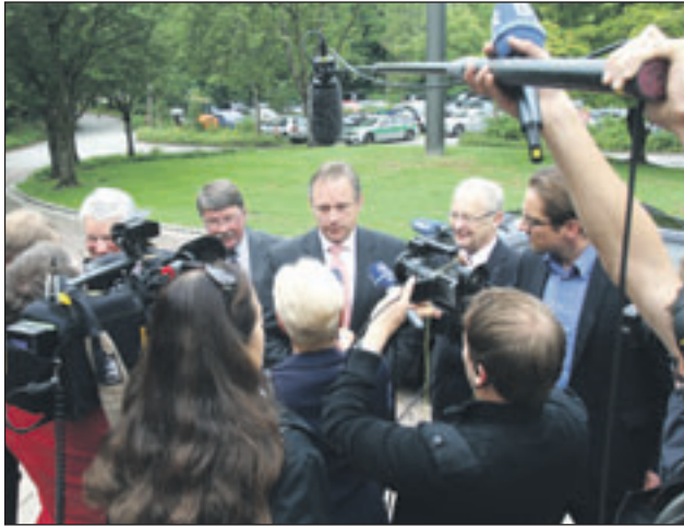
Großes Medieninteresse bei der Ankunft von Finanzminister Georg Fahrenscho. □