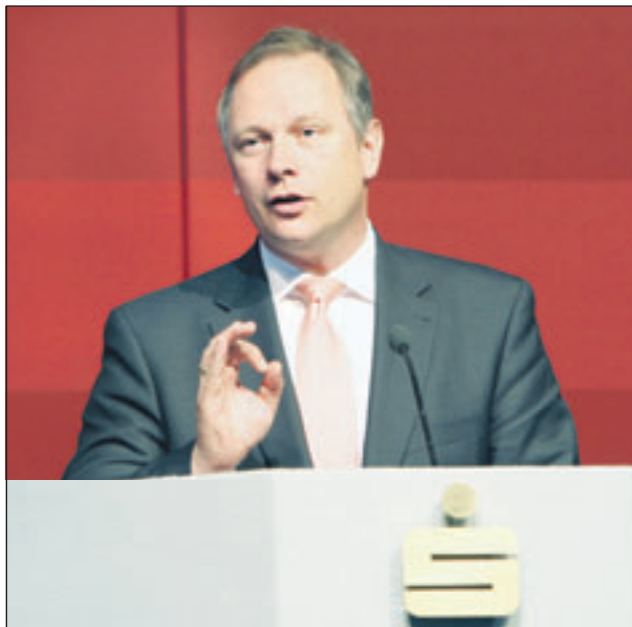
Finanzminister Georg Fahrenschoon. □

wortlich, „dass Bayern besser und schneller, vor allem aber gestärkt aus der Krise gekommen ist“, konstatierte der Minister und verdeutlichte: „Wir haben bundesweit die niedrigste Arbeitslosen-