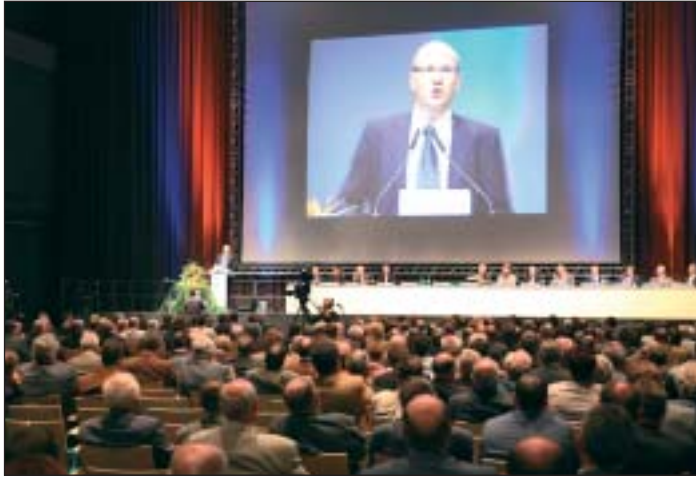
Fast 5.000 Besucher zählte die KOMMUNALE in Nürnberg. Der große Teil der Gäste waren bayerische Bürgermeister und deren Mitarbeiter, die als Mitglieder des Bayerischen Gemeindetags die Jahrestagung ihres Verbandes besuchten.

Bayerischer Gemeindetag 2007 in Nürnberg: