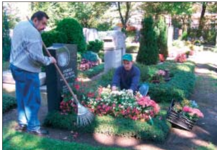
Ein Service für Angehörige, die weit weg wohnen: Zwei Mitarbeiter der Nürnberger Friedhofsgenossenschaft pflegen ein Grab. □

Die ungarische Schauspielerinnen Sunnyi Melles und der Münchner Stahlbildhauer Alf Lechner werden am 28. Juni 2008 im „schatzof - europäisches künstlerhaus oberbayern“ in Freising mit dem Oberbayerischen Kulturpreis ausgezeichnet. Multitalent Sunnyi Melles hatte ihren Durchbruch ab 1980 an den Münchner Kammerspielen u. a. als Gretchen in der legendären Faust-Inszenierung. 2003 folgte sie Regisseur Dieter Dorn an das Bayerische Staatsschauspiel München. Alf Lechner ist einer der bedeutendsten Stahlbildhauer der Gegenwart. Viele seiner Arbeiten sind in den öffentlichen Raum integriert, z. B. in Ingolstadt, München und Hamburg. □