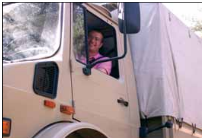
Mit dem neuen Telematiksystem können wesentliche Geschäftsprozesse nunmehr effizienter gestaltet werden. □