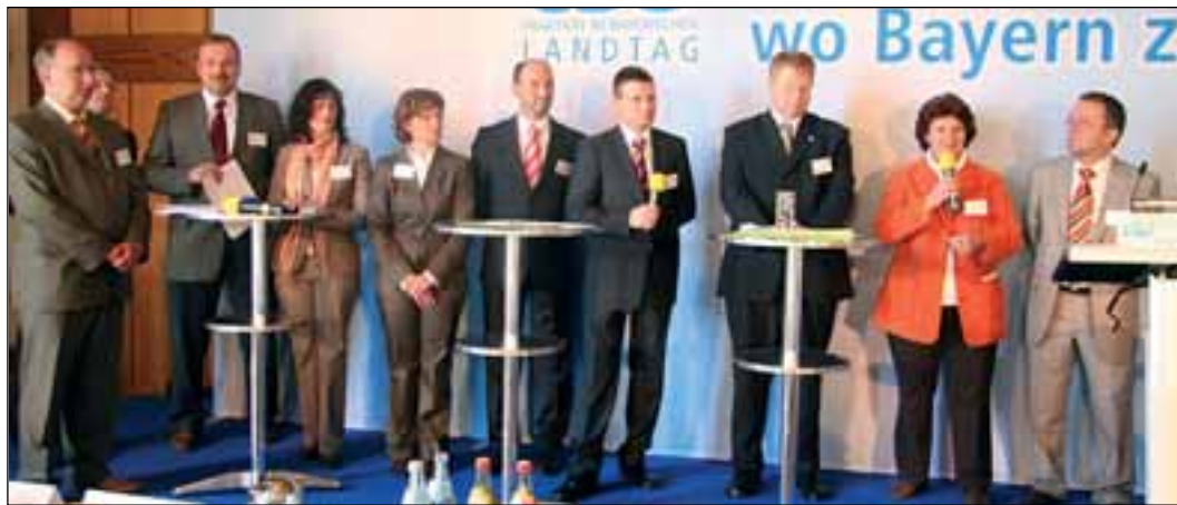
Das Podium in Wiesau: „Ideenbörse - Erfolgreiche Initiativen vor Ort“.