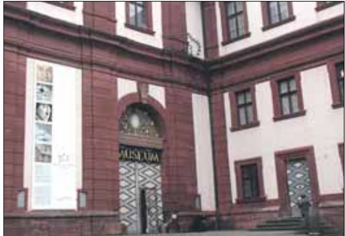
Das Mainfränkische Museum auf der Würzburger Festung Marienberg lockte 2005 erstmals wieder mehr Besuch an.

Gespart werden soll weiterhin dadurch, dass bei jedem extern vergebenen Auftrag und jeder Anschaffung hart um Rabatte gefeilscht wird. Auch die Jagd nach Sponsoren wird intensiv vom Museumsteam betrieben. Dies jedoch, gibt Semmel zu, gestaltet sich in Zeiten, in der jede Kultureinrichtung um Mäzene wirbt, äußerst schwierig: „Meist kommt uns das Stadttheater zuvor.“