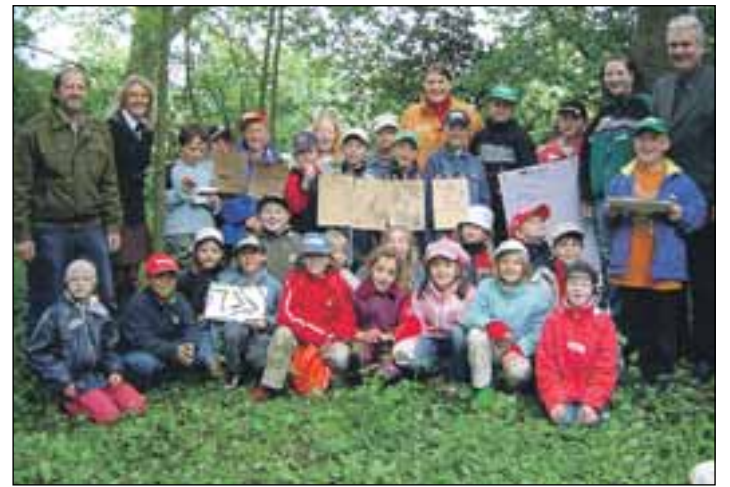
Für die Schwanfelder Schüler stand ein lebhafter und erlebnisreicher Unterricht auf dem Programm. □

Auch in diesem Jahr wird während der Messe die GaLaBau-Innovations-Medaille verliehen. Ausgezeichnet werden neue und fortschrittliche Produkte und Verfahren für den Bau und die Pflege landschaftsgärtnerischer Anlagen. Die Medaille gilt in der Branche inzwischen als eine Art Qualitätssiegel. Alle Aussteller der GaLaBau, die ein neues Produkt oder eine wesentliche Weiterentwicklung anbieten, sind zur Teilnahme eingeladen. Detaillierte Informationen wie Teilnahmebedingungen sind beim Auslober der Innovations-Medaille, dem BGL, erhältlich. □