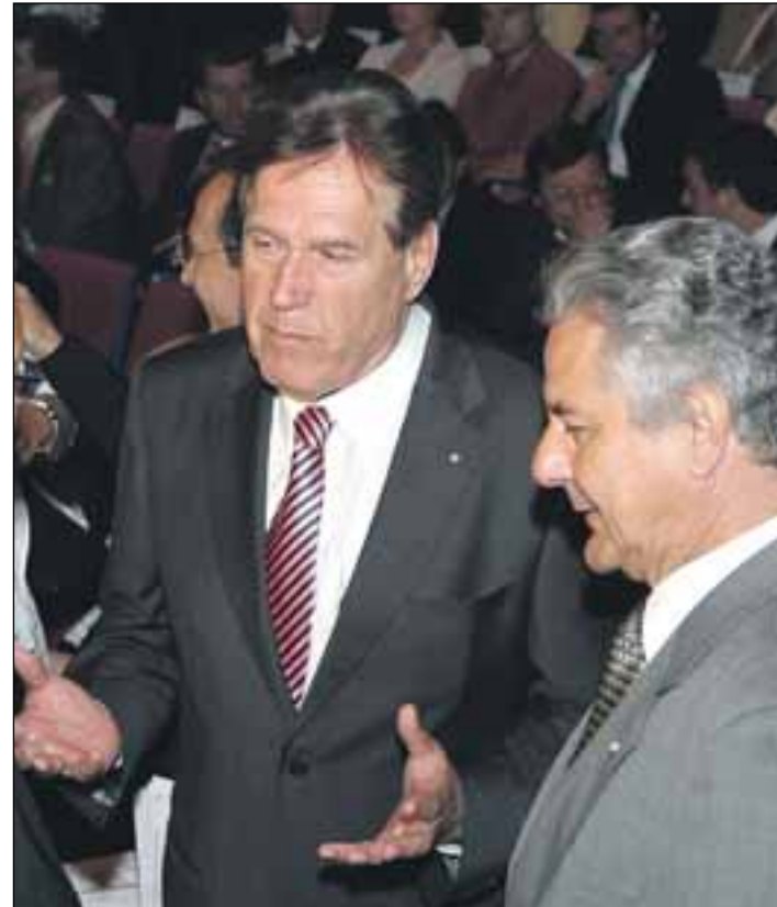
Bayerns Finanzminister Prof. Kurt Faltlhauser (r.) mit Bundeswirtschaftsminister Michael Glos.

Der Finanzminister verwies in diesem Zusammenhang auch auf wichtige bayerische Initiativen zur Deregulierung der Bankenaufsicht: So wurde auf Initiative Bayerns die absolute Offenlegungsgrenze auf 750.000 Euro erhöht. Damit herrsche nun bei den Offenlegungsvorschriften Wettbewerbsgleichheit zu Österreich. Darüber hinaus habe der Bundesrat, ebenfalls auf Initiative Bayerns, eine umfangreiche Entschleunigung zum Abbau der