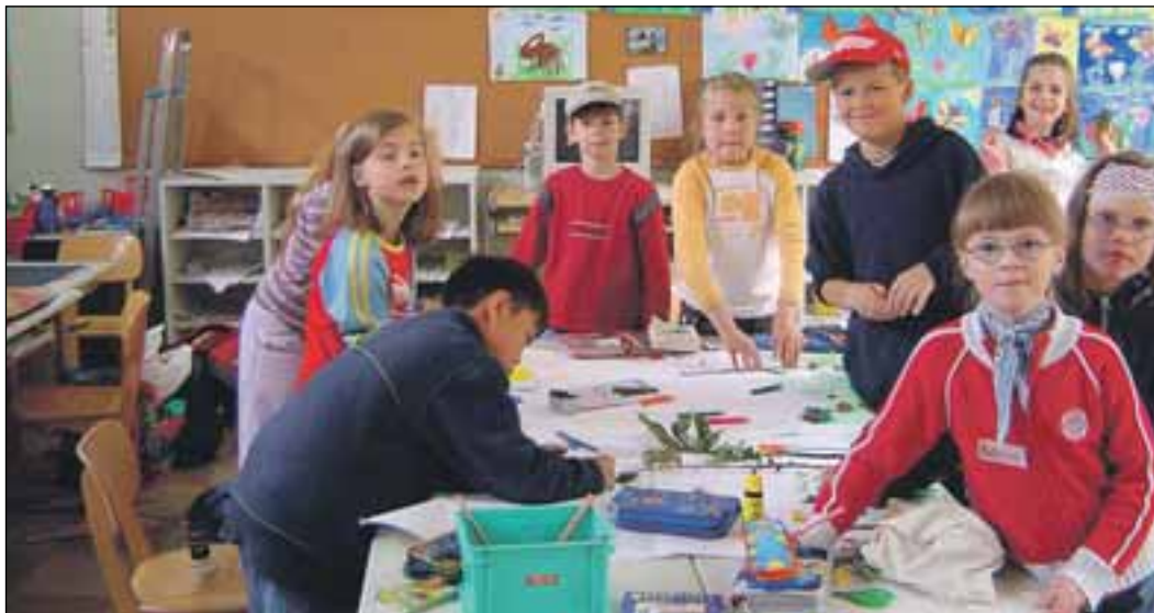
Spielend lernen mit allen Sinnen: Für die Kinder der Schwanfelder Grundschule stand ein lebhafter und erlebnisreicher Unterricht auf dem Programm. Drei Tage lang war die Rollende Spielkiste mit dem Projekt „Entdecke die Hecke“ zu Gast in der Klasse 2b (vgl. Seite 12).

Wer mit bayerischer Kommunalpolitik und mit Wirtschafts- und Umweltfragen zu tun hat, der braucht die Bayerische Gemeindezeitung als umfassende Informationsquelle für Kommunalpolitiker