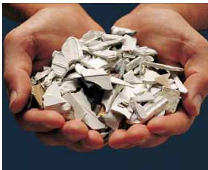
Reste eines Altfensters aus Kunststoff. □