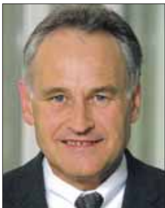
Staatsminister Erwin Huber

Dass sein Ministerium in punkto Stärkung des ländlichen Raums mit gutem Beispiel vorangeht, darauf verwies Landwirtschaftsminister Josef Miller. Es biete auch in Zeiten knapper