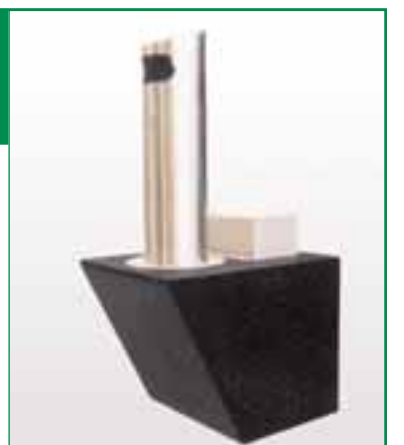
Absaugen statt schütten. Unterirdisch statt sichtbar.