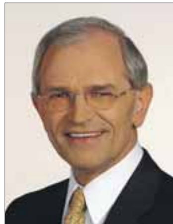
Dr. Günther Denzler.

So hat sie die Errichtung eines Innovations- und Gründerzentrums und den Aufbau des IT-Clusters Bamberg zusammen mit der Stadt Bamberg maßgeblich mitbetreut, die Wirtschaftsregion Bamberg-Forchheim mit auf den Weg gebracht und die Einbindung des Landkreises in die Metropolregion Nürnberg erreicht (dort ist Denzler inzwischen stellvertretender Ratsvorsitzender). Die Wirtschaft dankt es mit Neuansiedlungen und Firmenerweiterungen, die Presse mit immer besseren Rankings (FOCUS MONEY: Rang 18 unter den Top-Aufsteigerregionen Deutschlands).