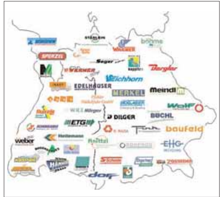
Übersicht der LOGEX-Vertragspartner.

Finanziert werden die Entsorgungsleistungen aus den Beiträgen der Batteriehersteller und -importeure, die Vertragspartner von GRS Batterien sind. Deren Zahl stieg im Laufe des Jahres 2005 um 120 Unternehmen auf nunmehr 736 Nutzer - ein Plus von ca. 20 Prozent). Die Höhe der Entsorgungskostenbeiträge ist abhängig vom Gewicht, dem elektrochemischen System und der Stückzahl der Batterien, die das jeweilige Unternehmen in Deutschland in Verkehr bringt. □