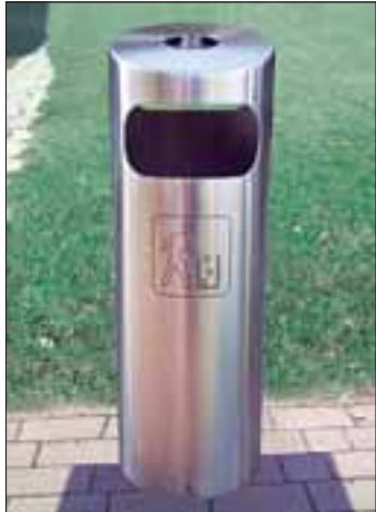
Die neue Müllkörbe-Generation fasst sagenhafte 650 Liter. □

Bis normale Müllbehälter überquellen, vergehen oft nur Minuten. Die neue Generation der Müllkörbe fasst 650 Liter und kann damit 12 bis 20 mal mehr Abfall aufnehmen als ein her-