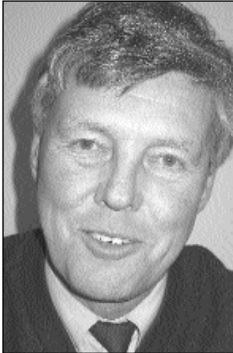
Josef Göppel.

Jetzt hat Josef Göppel, der seit 2002 als Nachfolger von Carl-Dieter Spranger im Berliner Reichstag sitzt, sogar den „Deutschen Solarpreis 2004“ bekommen, den „Eurosolar“, den die Europäische Vereini-