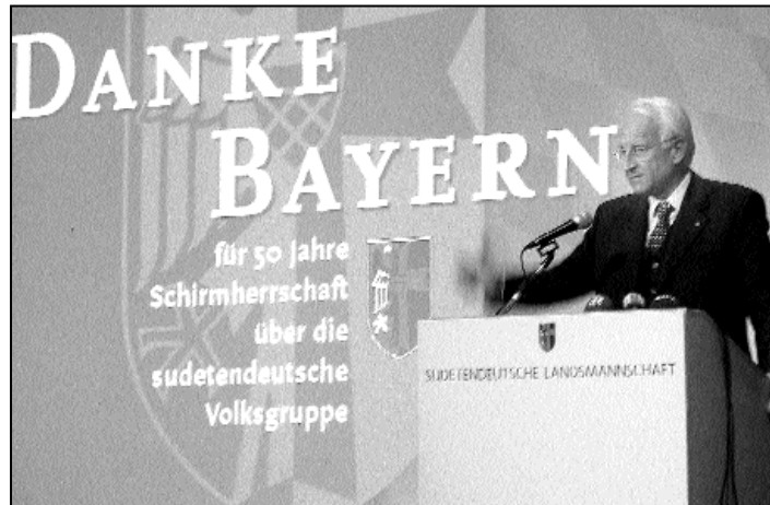
„Danke Bayern“ sagte die Sudetendeutsche Volksgruppe für 50 Jahre Schirmherrschaft des Freistaats. Zum Festakt kam Ministerpräsident Dr. Edmund Stoiber.

Republik und auch gegenüber den Sudetendeutschen, die von der Vertreibung besonders hart getroffen waren.