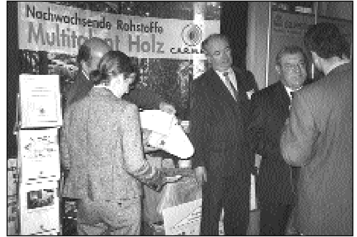
C.A.R.M.E.N. präsentierte im Rahmen des Klimagipfels eine Ausstellung über die Energiegewinnung aus Biomasse.

Weitere Infos gibt es bei C.A.R.M.E.N., Schulgasse 18, Tel.: 09421/960-300, E-Mail: contact@carmen-ev.de ( http://www.carmen-ev.de )