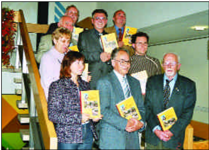
Die Autoren mit Bürgermeister Maximilian Gaul (oben Mitte) bei der Präsentation im Roßtaler Rathaus.