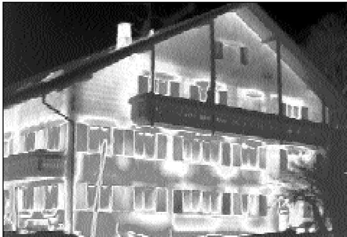
Auf der Thermografie dieses Allgäuer Bauernhauses sind die Wärmeverluste deutlich sichtbar.

Mit kleinem Aufwand große Wirkung zu erreichen, könnte auch für andere Allgäuer Kommunen ein Anreiz für das kommunale Energiemanagement sein. Zumal der Freistaat Bayern diese Dienstleistung fördert: „Die Stadt Mindelheim bekommt dafür eine Förderung des Bayerischen Staatsministeriums für Umwelt, Gesundheit und Verbraucherschutz aus Mitteln des Allgemeinen Umweltfonds, der Rest amortisiert sich durch die Einsparungen wahrscheinlich schon im ersten Jahr“, rechnet eza!-Geschäftsführer Martin Sambale vor.