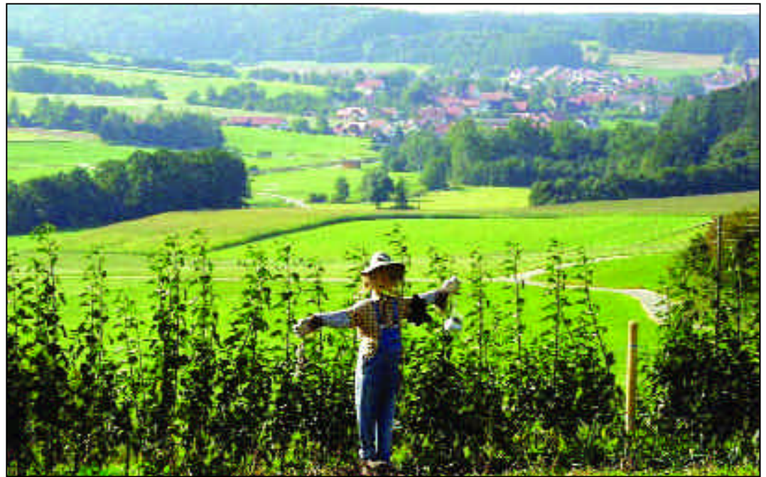
Auf 140 Seiten zeichnen die Autoren ein vielschichtiges Bild der einzigartigen Staudenlandschaft wie hier rund um Walkertshofen.