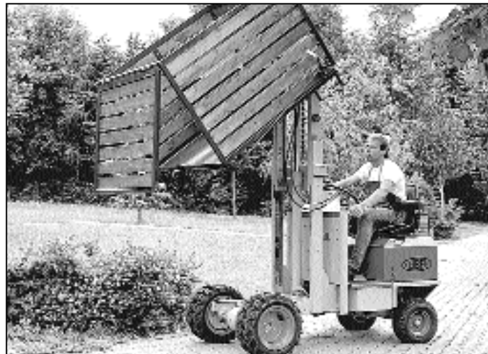
Großes Interesse findet immer wieder Leiber HTA, das äußerst rationelle Abfallsammelsystem für den Ein-Mann-Betrieb. Die Anschaffung amortisiert sich in kürzester Zeit. Bei starkem Abfallaufkommen kann schnell und direkt reagiert werden.

LEIBER oHG, Bereich Fahrzeugbau, D-78574 Emmingen, Telefon 07465/292-0, www.leiber.com