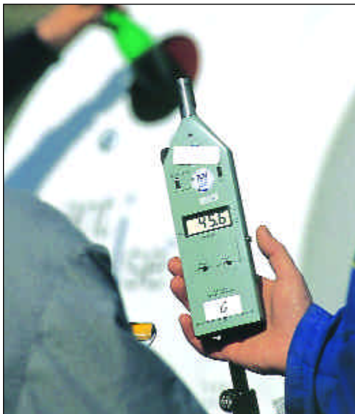
Lärmmessung am Altglascontainer.