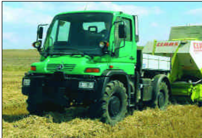
Die Agrar-Variante U 400 A aus der geländegängigen Geräte-träger-Baureihe U 300 - U 500.

Auch der Komfort und der Rundumblick, den der Bediener vom BOKIMOBIL bereits gewohnt ist, ist geblieben. Denn auch hier hat das Dorfener Maschinenbauunternehmen getreu seinem Motto gehandelt: Innovation vorantreiben, jedoch Bewährtes erhalten.