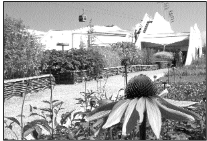
Einer der größten Highlights auf der BUGA wird der Deutsche Pavillon sein. Das Photo zeigt ihn auf der Internationalen Gartenbauausstellung (IGA) in Rostock 2003, wo er schon einmal erfolgreich für Nachhaltigkeit in der Produktion und Verwendung von Pflanzen warb.

Der heute 33 Hektar große Taxetwald im Süden der Gemeinde ist als Bannwald ausgewiesen. Seit der Wiederaufforstung in den 90er Jahren ist er unverzichtbarer Bestandteil der Naturlandschaft und hat eine große Schutz-, Nutz- und Erholungsfunktion. Zur BUGA soll auch die Geschichte des Taxet herausgearbeitet werden. DK