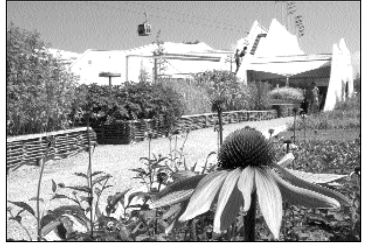
Einer der größten Highlights auf der BUGA wird der Deutsche Pavillon sein. Das Photo zeigt ihn auf der Internationalen Gartenbauausstellung (IGA) in Rostock 2003, wo er schon einmal erfolgreich für Nachhaltigkeit in der Produktion und Verwendung von Pflanzen warb.

Der heute 33 Hektar große Taxetwald im Süden der Gemeinde ist als Bannwald ausgewiesen. Seit der Wiederaufforstung in den 90er Jahren ist er unverzichtbarer Bestandteil der Naturlandschaft und hat eine große Schutz-, Nutz- und Erholungsfunktion. Zur BUGA soll auch die Geschichte des Taxet herausgearbeitet werden. DK