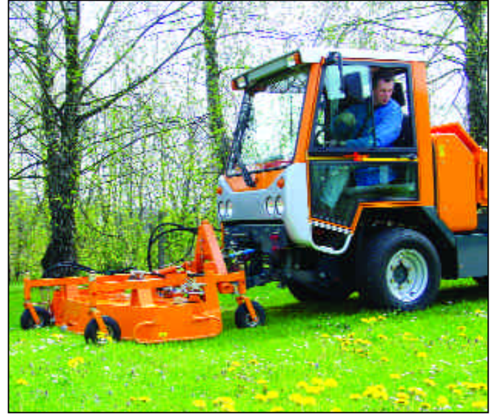
BOKIMOBIL Kommunal-Fahrzeug Typ 1151:

Darüber hinaus bietet EFM eine ganz spezielle Dienstleistung: Allen Trinkwasserversorgern, die eigene Trinkwasserbrunnen betreiben, wird der komplette Service von der technischen Instandhaltung der Brunnen bis hin zur hygienischen Überwachung mit regelmäßigen Wassermessungen, Probeentnahmen und allen vorgeschriebenen Laboruntersuchungen geboten.