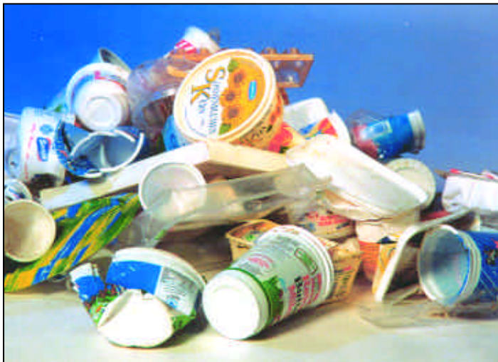
Die Zahl spricht für sich: Mehr als sechs Millionen Tonnen gebrauchte Kunststoffverpackungen hat die DKR seit ihrer Gründung 1993 einer sicheren Verwertung zugeführt.