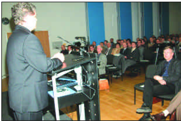
Präsident Peter Czommer von der Direktion für Ländliche Entwicklung moderiert die Veranstaltung.

Er plädierte für eine Zusammenarbeit mit diesen Behörden bei der Förderung, den Förderverfahren und beim vorbeugenden Hochwasserschutz. Er rief den Kommunalpolitikern, die Kooperation öffentlich darzu-