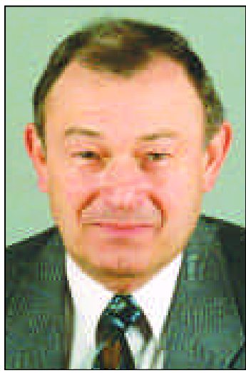
Dr. Günther Beckstein.

Während es 2002 noch einen Anstieg von über 9 % bei der Gewaltkriminalität gab, gelang es diesen Trend letztes Jahr bei 20.542 Delikten (+0,3 %) praktisch zu stoppen. Etwas zurückgingen die Raubdelikte auf 3.412 Taten, nachdem sie 2002 deutlich angestiegen waren. Trotz 1.188 Vergewaltigungen (+ 37 Fälle; + 3,2 %) blieben diese wieder unter denen des Jahres 2001. Vor allem gesunken sind die überfallartigen Vergewaltigungen, die der Öffentlichkeit (Fortsetzung auf Seite 4)