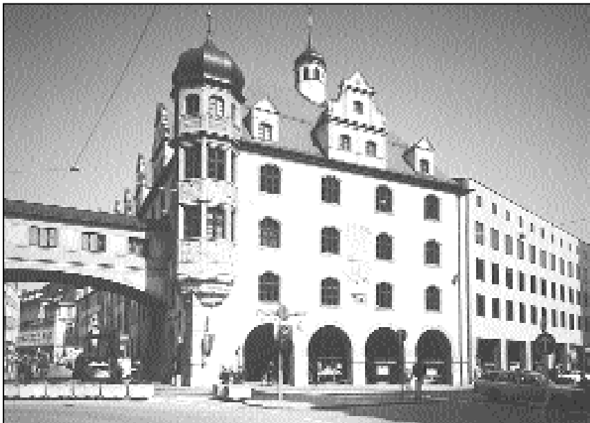
Zu Recht werden begehrlche Blicke auf die schönen Töchter der Kommunen, die Sparkassen, geworfen. In Bayern gäbe es besonders attraktive Exemplare. Unser Bild zeigt die Hauptverwaltung der Münchner Stadtsparkasse.