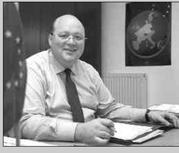
Maget, Alternativvorschläge an.

Die Wahrung kommunaler Zuständigkeit und Kooperationen mit privaten Unternehmen sind kein Widerspruch. Dies ist in vielen Formen möglich - u.a. durch Privatisierung oder Konzessionsvergabe - und wird bereits praktiziert. Bewahrt werden muss die lokale Definitivität. Die Durchführung durch Private kann nach Maßgabe der Kommunen bereits heute erfolgen. Daseinsvorsorge und Wettbewerb haben die selben Ziele: beide wollen optimale Leistungen für die Bürger gewährleisten.