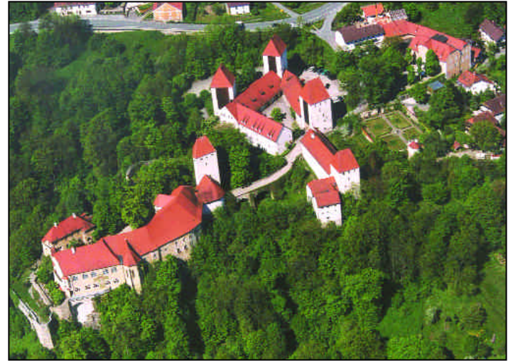
Ein ehrgeiziges Sanierungsprojekt: Blick auf die Schlossanlage.

In dem neuen jüdischen Gemeindezentrum wird neben einer Synagoge eine jüdische Schule, ein Kindergarten, ein Gemeindezentrum sowie ein koscheres Restaurant entstehen. Mit in den Komplex wird das jüdische Museum der Landeshauptstadt München integriert. Mit rund 8.000 Mitgliedern ist die israelitische Kultusgemeinde in München und Oberbayern die zweitgrößte jüdische Gemeinde in Deutschland. Der Freistaat Bayern unterstützt das Gemeindeleben in den israelitischen Kultusgemeinden im Rahmen eines eigenen Staatsvertrages. z