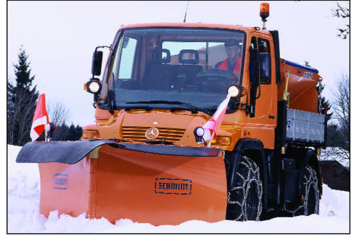
Unimog-Geräteträger von Mercedes-Benz bewähren sich im Ganzjahreseinsatz. Jetzt ist der richtige Zeitpunkt, um mit den Vorbereitungen für den Wintereinsatz zu beginnen.

Ob unterwegs im Actros, im Sprinter oder im Unimog - selbst im Omnibus - für alle, die Nutzfahrzeuge von Mercedes-Benz steuern, gibt es jetzt eine neue Ausstattungs-Kollektion, die so genannte „DriversLine“. Von A wie Aschenbecher bis Z wie Zippo-Feuerzeug umfasst die „DriversLine“ rund 80 verschiedene Produkte. Darunter ist viel Nützliches wie beispielsweise ein Nähset, ein Taschenschirm oder eine Isolierflasche - und Schönes wie Brieftaschen oder Sonnenbrillen. Natürlich ist auch das Angebot an Kleidung breit gefächert und reicht von T-Shirts über Jacken und Pullover bis hin zu Kappen, aber es gibt auch erstmals Accessoires wie