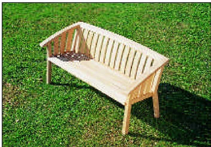
Formschöne und langlebige Produkte: Hier ein Ausschnitt aus dem Jahreskatalog 2003 der Nusser GmbH & Co. KG.

Beckstein befürchtet außerdem, dass mit den vom Bund geplanten neuen Maßnahmen der innerstädtischen Strukturverbesserung künftig auch völlig am Bedarf vorbei geplant wird: „Wenn den jungen Familien nach Wegfall der Eigenheimzulage kein Geld mehr für die teureren Wohnungen in den Städten bleibt, helfen dort auch keine städtebaulichen Begleitmaßnahmen.“ Es kann laut Beckstein auch nicht angehen, dass der Bund die Eigenheimzulage ganz streicht und nur 25 Prozent der frei werdenden Mittel für Wohnungs- und Städtebau einsetzt. Dafür müssten aber die Kommunen einen erheblichen Mitfinanzierungsanteil leisten, wozu sie auf Grund der bekannt schlechten finanziellen Situation nicht in der Lage sind. Das vorgeschlagene Maßnahmenpaket entwickle im übrigen keinesfalls die bisherige Anstoßwirkung der Eigenheimzulage für Privatinvestitionen, so dass weiterhin mit gravierenden Folgen für die Bauwirtschaft, z. B. mit dem von dieser prognostizierten Abbau von 80.000 Arbeitsplätzen zu rechnen ist. Eine Mogelpackung sieht Beckstein darin, dass ein Teil der Aufstockungen bei den Städtebauförderungsprogrammen durch Kürzung bisheriger Programmansätze erfolgen soll.