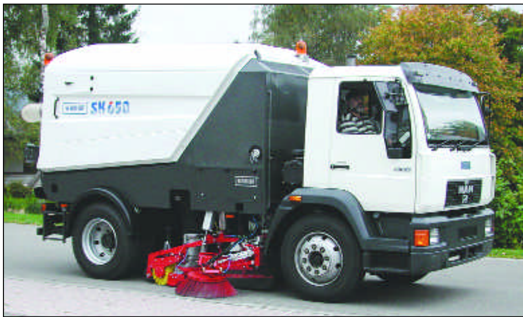
Die neue LKW-Aufbaukehrmaschine SK 650 von SCHMIDT verspricht stressfreies Arbeiten. ☞