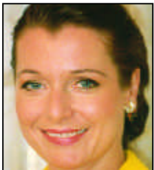
Dr. Gabriele Pauli:

Anlässlich des Internationalen Weltfrauentags rief der Ministerpräsident dazu auf, an der Verwirklichung der Chancengleichheit mitzuwirken. Seite 2