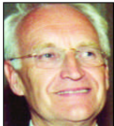
Dr. Edmund Stoiber: