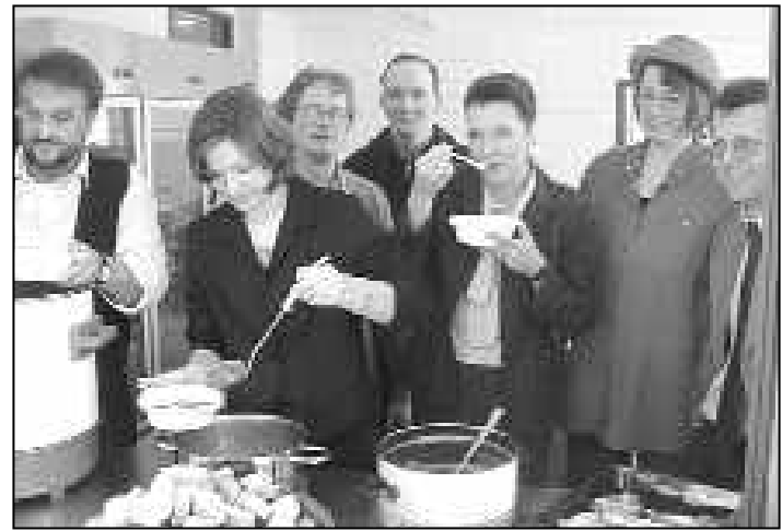
Erster Arbeitstag: Abteilungsleiter kochen für Mitarbeiter.